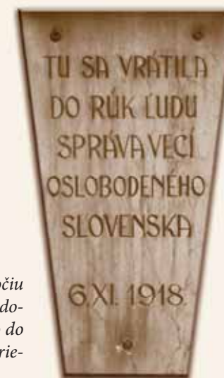
Radnica - pôvodná neskororenesančná budova radnice na námestí bola vybudovaná na starších základoch v prvej tretine 17. storočia. V 18. storočí ju prestavali v barokovom štýle a od konca 18. storočia sa stala sídlom mestskej správy. V roku 1918 tu v dňoch 6. až 14. novembra 1918 po vzniku Československej republiky sídlila Československá dočasná vláda pre Slovensko.