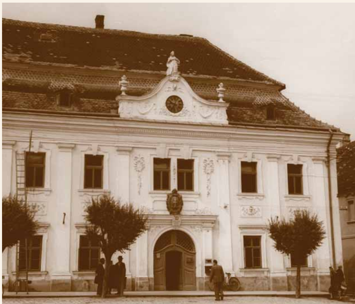
Pamätná tabuľa k 10. výročiu príchodu Československej dočasnej vlády pre Slovensko do Skalice, umiestnená na priečelí radnice v roku 1928.